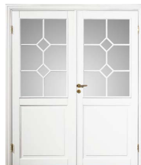
Kungsäter 533 Standard vit Klarglas