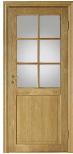
Kungsäter 532 Ek klarlack Klarglas