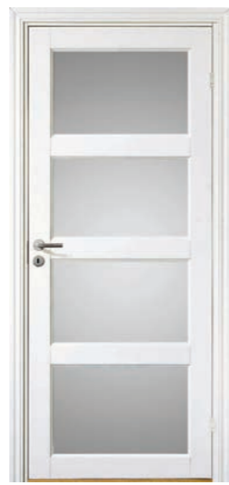
Kungsäter Jubileum 701 Standard vit Opalglas