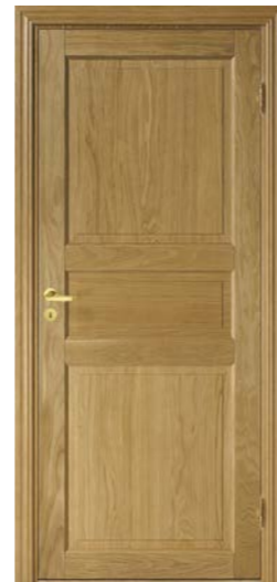
Kungsäter 522 Ek klarlack