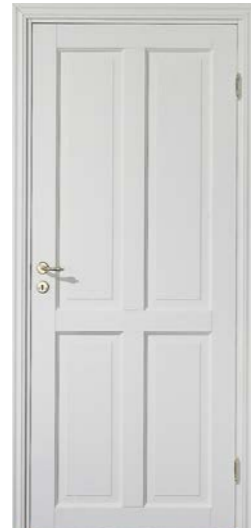
Kungsäter 524 Valfri NCS S