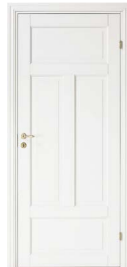
Kungsäter 523 Standard vit