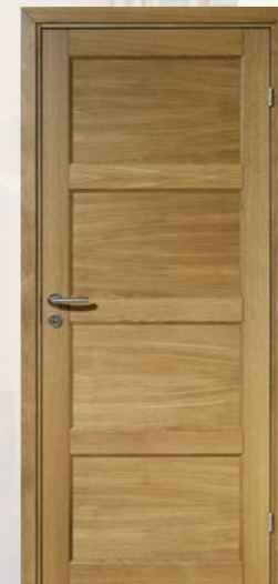
Kungsäter Jubileum 710 Ek klarlack