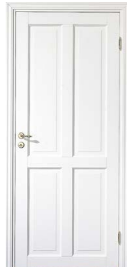
Kungsäter 524 Standard vit