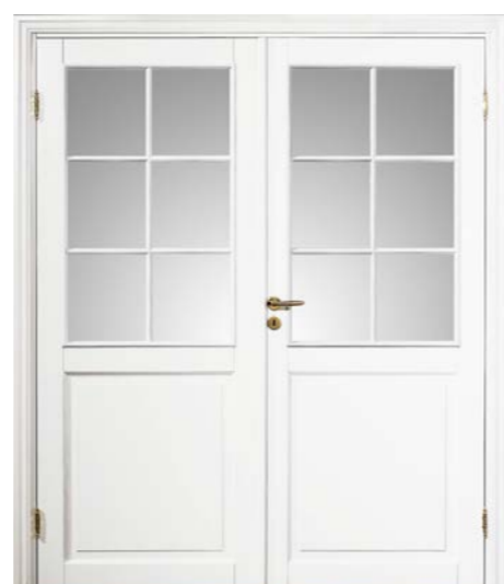
Kungsäter 532 Standard vit Klarglas