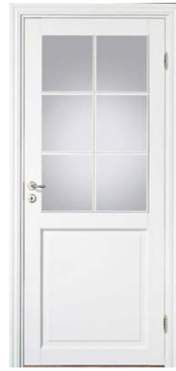
Kungsäter 532 Standard vit Klarglas