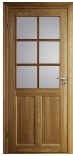
Kungsäter 535 Ek klarlack Klarglas