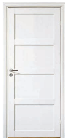
Kungsäter Jubileum 700 Standard vit