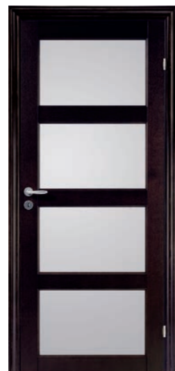
Kungsäter Jubileum 711 Wengebetsad ek Opalglas