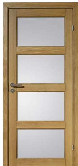
Kungsäter Jubileum 711 Ek klarlack Opalglas