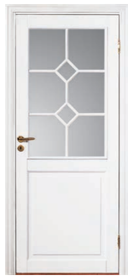
Kungsäter 533 Standard vit Klarglas