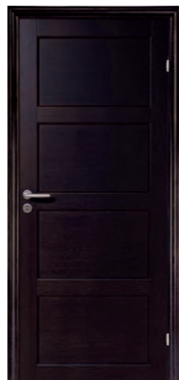
Kungsäter Jubileum 710 Wengebetsad ek