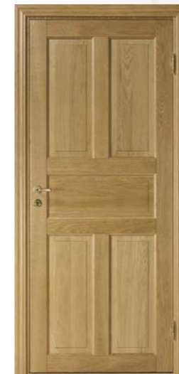
Kungsäter 525 Ek klarlack