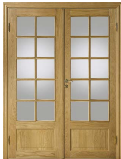
Kungsäter 530 Ek klarlack Klarglas

De täta Kungsäterdörrarna kan levereras i brandklass EI30/R'w30dB och EI30/R'w35dB.