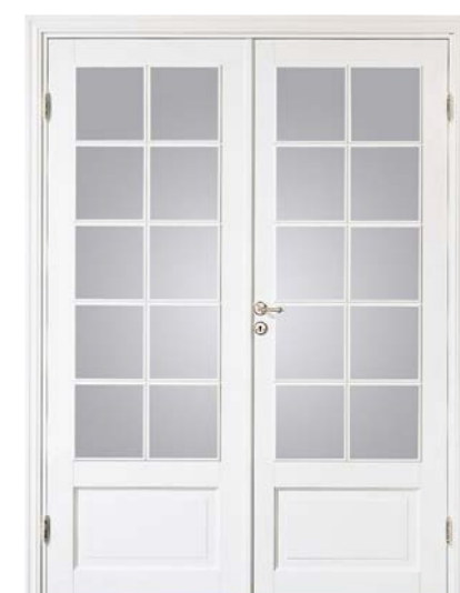
Kungsäter 530 Standard vit Klarglas