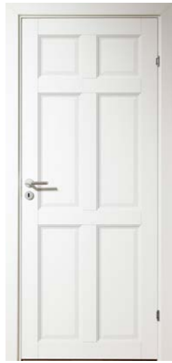
Kungsäter 526 Standard vit