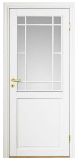
Kungsäter 534 Standard vit Klarglas