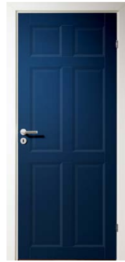
Kungsäter 526 Valfri NCS S