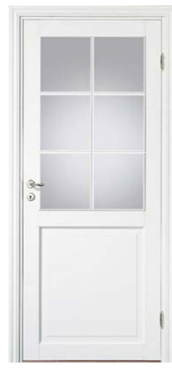
Kungsäter 532 Standard vit Klarglas