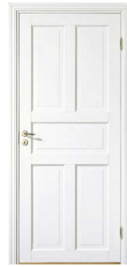
Kungsäter 525 Standard vit