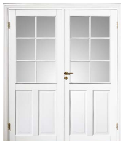
Kungsäter 535 Standard vit Klarglas