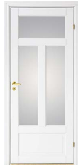
Kungsäter 523 special Standard vit Opalglass