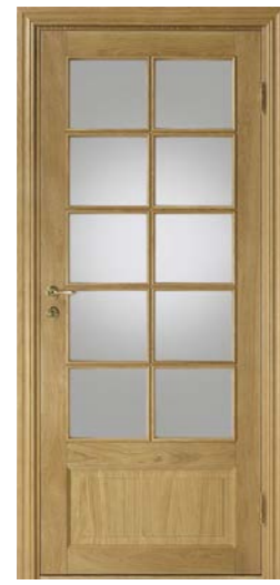
Kungsäter 530 Ek klarlack Klarglas