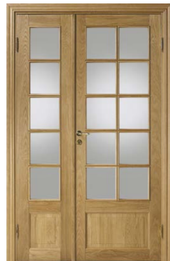
Kungsäter 530 Ek klarlack Klarglas