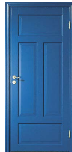
Kungsäter 523 Valfri NCS S