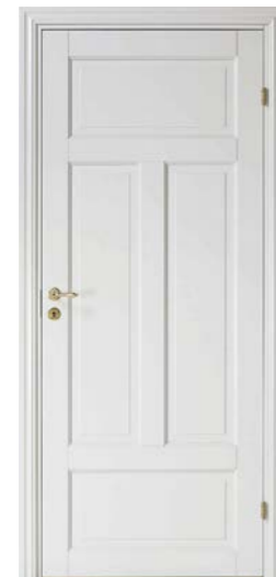
Kungsäter 523 Valfri NCS S