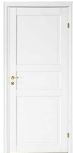
Kungsäter 522 Standard vit