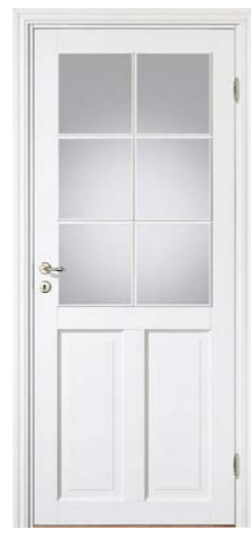
Kungsäter 535 Standard vit Klarglas