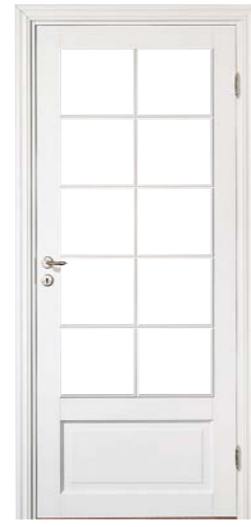
Kungsäter 530 Standard vit Klarglas