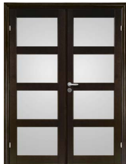
Kungsäter Jubileum 711 Wengebetsad ek Opalglas